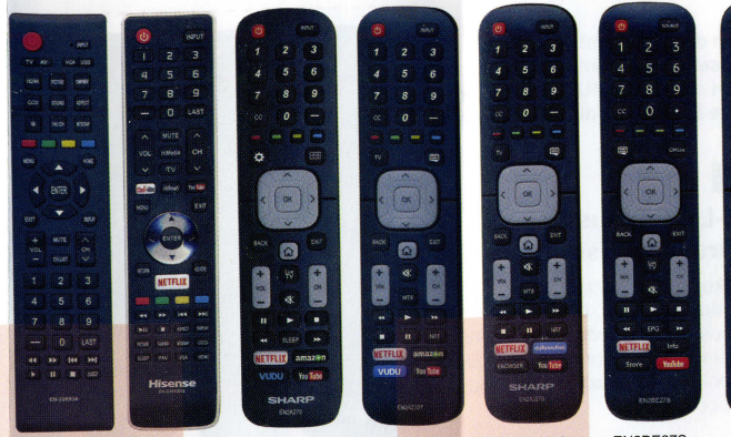
EN-22653A EN-33933HS EN2A27S EN2A27ST EN2A27TS EN2BE27S