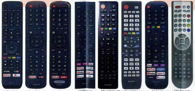
EN3G39 EN2T27HS EN2B27O ERF9A80 EN-22654HS EN-32951A EN2A30 EN-21662B