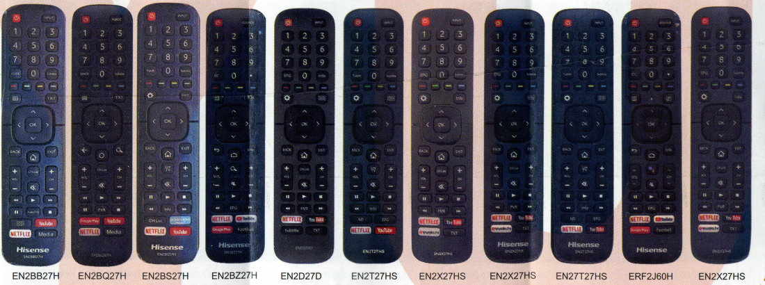
EN2B27H EN2BQ27H EN2BS27H EN2BZ27H EN2D27D EN2T27HS EN2X27HS EN2X27HS EN2T27HS ERF2J60H EN2X27HS