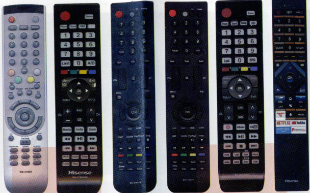
EN-31907 EN-32963HS ER-31607A ER-31607R ER-32961HS ERF3B72H