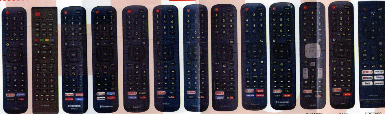
EN2G27 EN-22652A ERF2A60 ERF2G60H EN2A27HT EN2AG27 EN2AL27 EN2AS27H EN2BM27H EN2BD27H EN2A27S JM59 ERF3A90