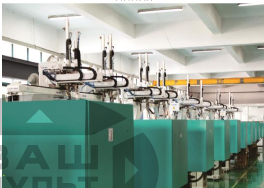
Отдел введения пресс-формы