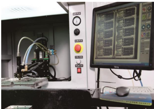
Автоматическая уплотнительная линия

Будучи оснащенными передовыми машинами, QUNDA может предоставить клиентам продукцию самого высокого качества и конкурентоспособную цену.