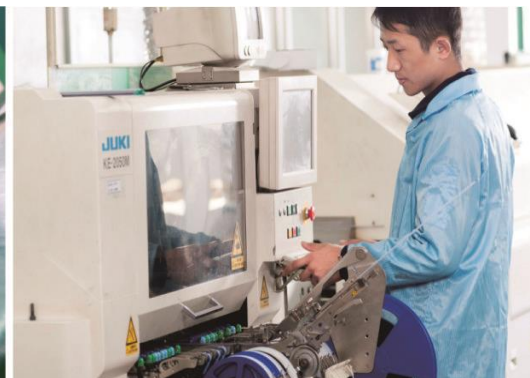
Поверхностный монтаж технологической линии