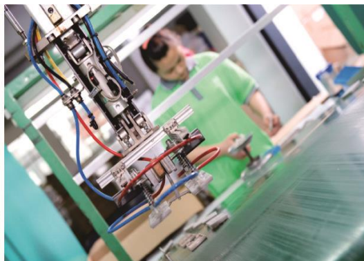
Механическое литье под давлением